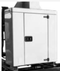
Cajón para almacenamiento de focos durante el desplazamiento.