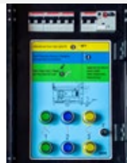
Cuadro de control y protección.