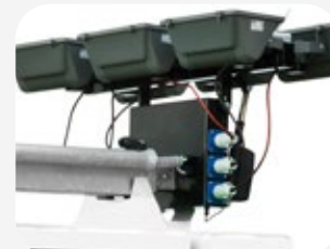
Caja de conexiones para facilitar el montaje y desmontaje de los focos.