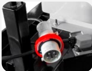
Manguera para conexión de potencia con clavija CEE16A/5P o CEE32A/5P