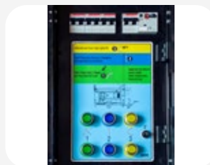
Panneau de contrôle et de protection.