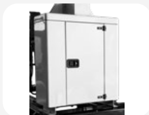
Armoire pour ranger les projecteurs pendant le transport.