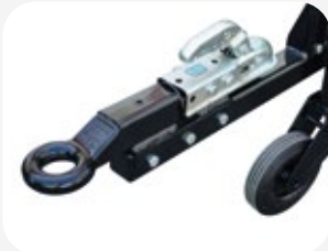
Double connexion pour remorquage: boule et anneau.