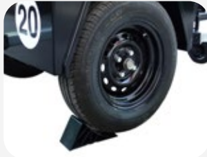
Roues avec pneus P175/80 R13 et calage de sécurité pour roue.