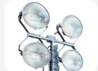
4 projecteurs halogène métallique 1.000 W chacun.