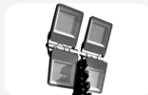
4 focos LED x 300 W/c.u.