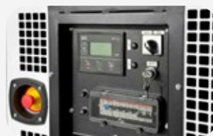
Cuadro de control sencillo y robusto.