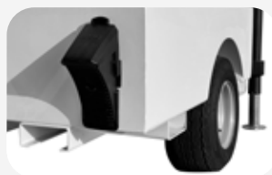
Ruedas con neumático 16.5x6.5-8" y calzo de seguridad para ruedas.