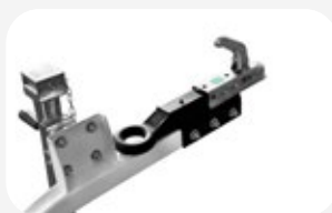
Lanza con enganche dual: anilla y bola.