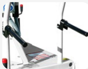
Manetas de transporte