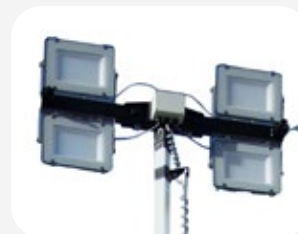
4 focos LED x 150 W