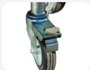
Freno de ruedas