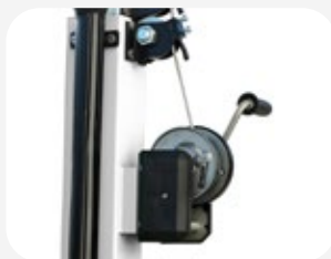
Sistema de elevación manual